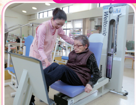
起立動作をスムーズに行えるようになりたい。