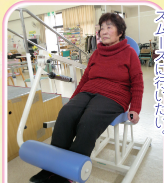
膝の痛みを軽減し、歩行をスムーズに行いたい。