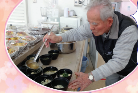
今日の昼食は格別においしいぞ!