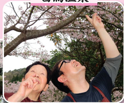
さわやかハウス利用者様