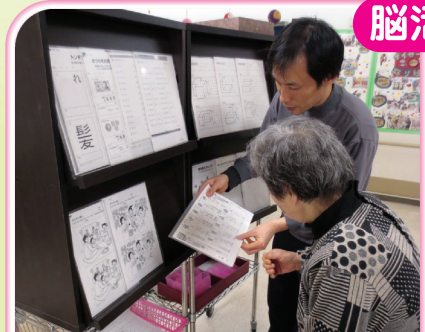
自分でプリントを選択できるよう50種類以上そろえています。