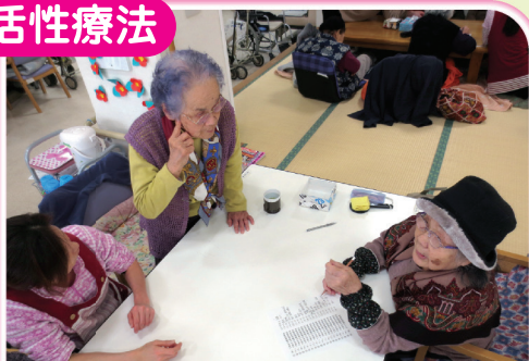
1人で悩まず協力して楽しく行っています。