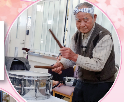
特技の太鼓を披露してくれました!