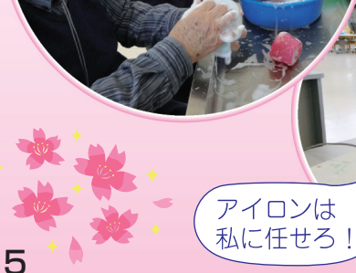
アイロンは私に任せろ!