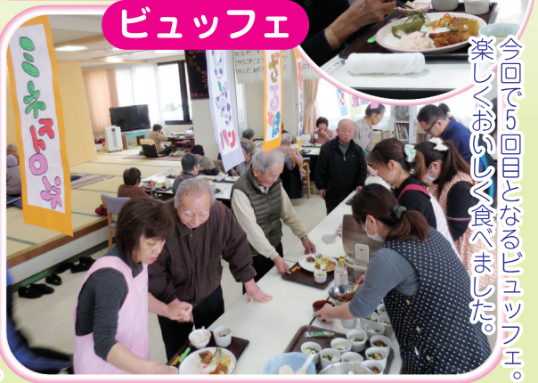
今回で5回目となるビュッフェ。楽しんでお食入りました。