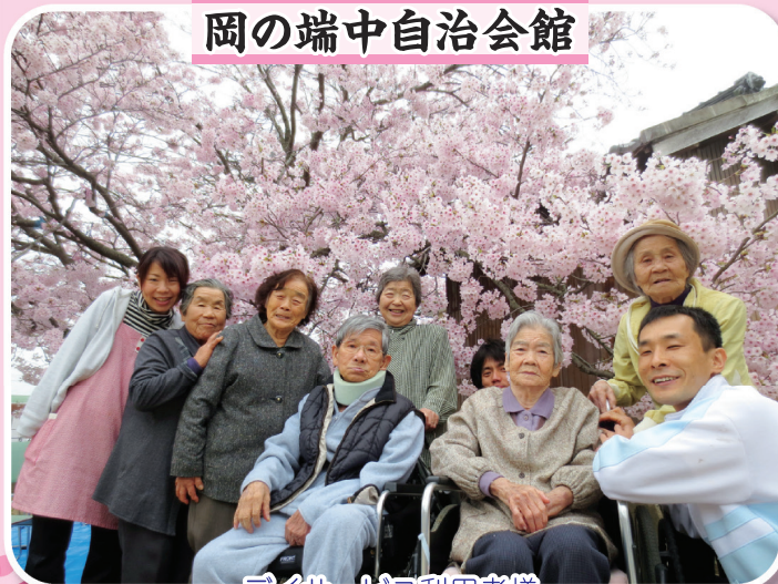
デイサービス利用者様