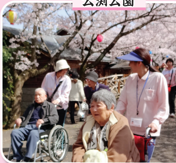
デイケア利用者様