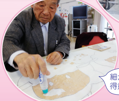
細かい作業が得意です!