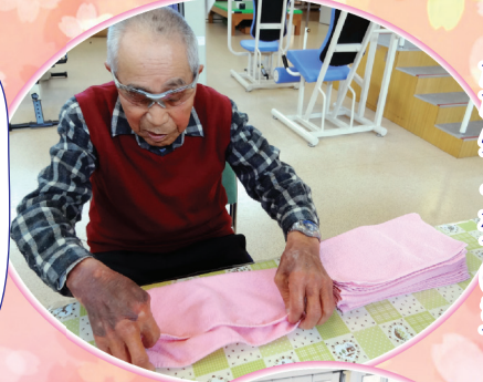
とても丁寧にたたんでくれています。

通所リハビリテーションでは男性利用者様も積極的に生活リハビリに取り組みられています。一人暮らしの方も多く、より長く在宅生活を続けていく為に必要な動作(家事や趣味活動など)を職員と共に楽しみながら行っています。