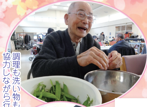
調理も洗い物も協力しながら行います。