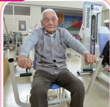
姿勢を正し杖歩行が安全に出来るように。