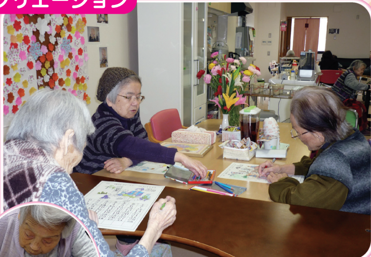
カレンダーづくり