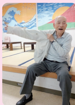
一人で着替えをする

平成27年4月の介護保険制度改正により、これからのリハビリは単なる機能回復訓練ではなく、「活動」「参加」に焦点をあて、日常の身の回りのことや、家事、仕事、趣味、地域活動など、生活行為の自立を目指すものとなります。利用者様の「したい」「できるようにになりたい」を実現できる様に一緒に考え、住み慣れた地域で生き生きとした生活を送っていただけるよう支援していきます。