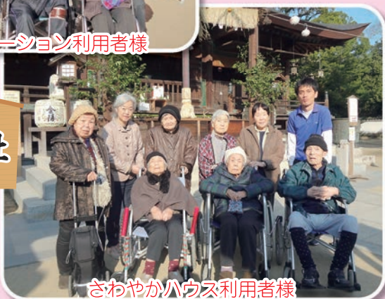
さわやかハウス利用者様