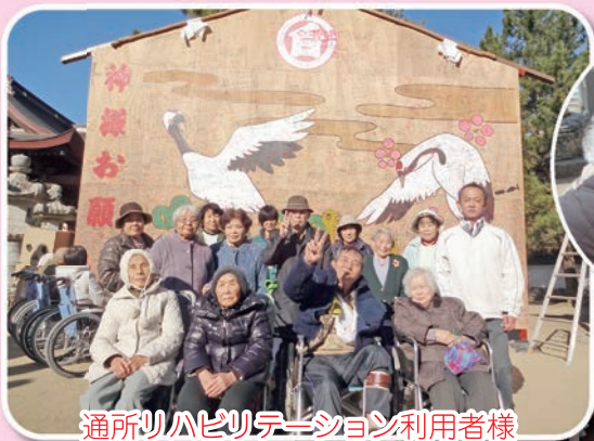
通所リハビリテーション利用者様