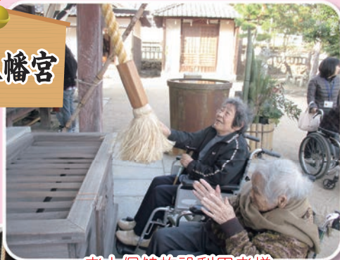
老人保健施設利用者様