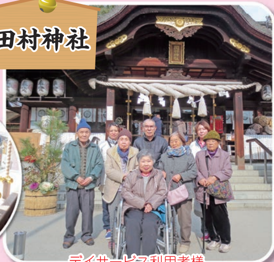
デイサービス利用者様