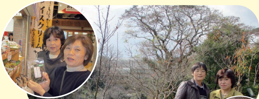
牧野植物園をみんなで散策しました。 気候も良かったです。 秋なので遠くの山には紅葉も。

介護をされているご家族の皆様の交流とリフレッシュを兼ねて、今回は高知に行ってきました。牧野植物園・ひろめ市場・園芸団地とかなり歩く旅行となりましたが、楽しかったというご意見をいただきました。ご参加いただきました皆様、今年もまた一緒に行けるといいですね。