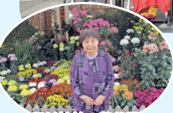
田村神社の菊花展

さわやか介護職員のレクリエーション活動部会では、2班に分かれて田村神社コースと屋島寺コースに利用者をご案内することにしました。そして、特養さわやかホーム・老人保健施設さわやか荘・グループホームさわやかハウスの利用者様に2つのコースに分かれていただいたの小旅行になりました。途中、昼食やおやつで久しぶりの外食もできて、大満足の楽しい一日になりました。