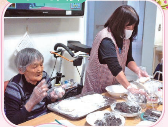
でき上がった熱々のお餅をちぎって、あんこ餅を作りました。皆でおいしくいただきました。