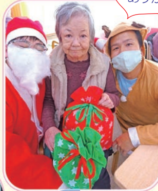
皆で歌を歌ったり、サンタさんから プレゼントを貰い盛り上がりました♪