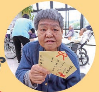
デイサービス利用者様、職員手作り「コロナ飛んでけ天満宮」