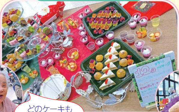
どのケーキも おいしかったよ