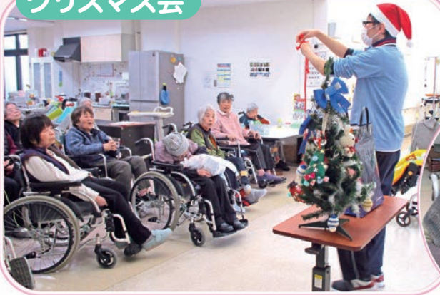
職員サンタによる手品を披露しました。どの手品も驚きの連続でおいに盛り上がりました。