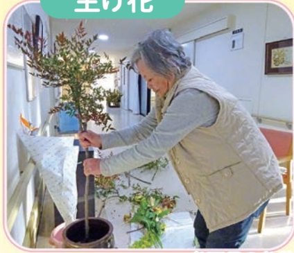
お正月のお花を生けました