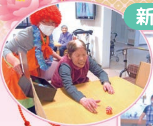
職員のかくし芸 に利用者の皆さんも大笑い。玉 ころがしゲーム もしました。