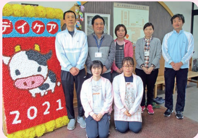
撮影時のみマスクを外しています

わたしたち相談員は、施設利用に関する窓口相談業務を行っています。施設利用に関するご相談がありましたら下記までご連絡ください。