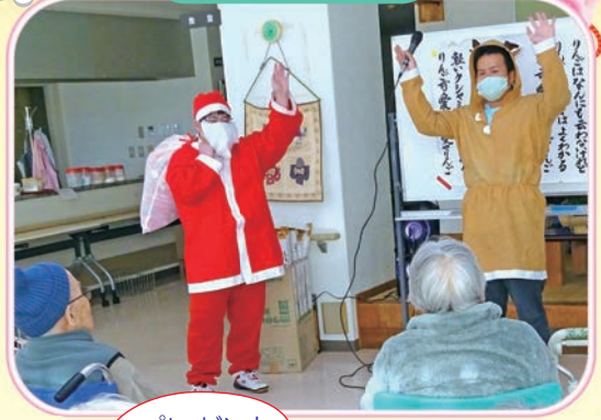
プレゼント ありがとう