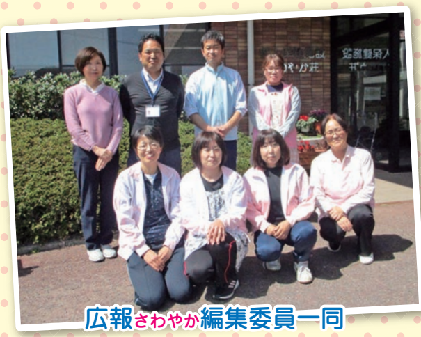
広報さわやか編集委員一同

西日本放送高松本社で、24時間テレビチャリティー委員会より福祉車両の贈呈式がありました。 全国の皆様方からの募金による福祉車両を大切に、そして有意義に活用したいと思います。