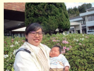
育児休暇取得中の職員

帰宅願望の強い利用者様、ひとり歩きされる利用者様にも安心したサービスが提供できるように顔認証徘徊防止システムの導入を検討します。