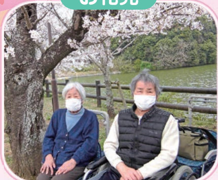
少人数でドライブをしました