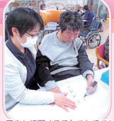
何度も練習することで左手でも上手に書けるようになりました