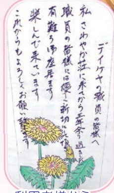
利用者様から職員へ心温まる絵手紙です