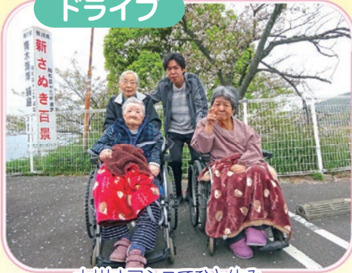
大川オアシスでひと休み