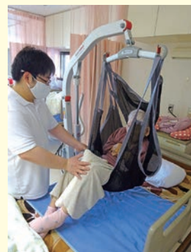
リフトを使用した移乗

介護ロボット(移乗支援等)の導入や福祉用具(リフト、スライディングボード等)の活用をすすめ、利用者様の自立支援と職員の介護負担の軽減にとりくみます。