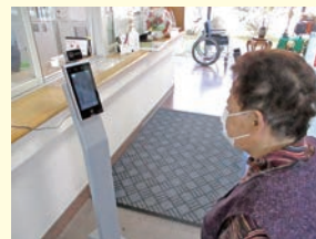
入館時の体温測定