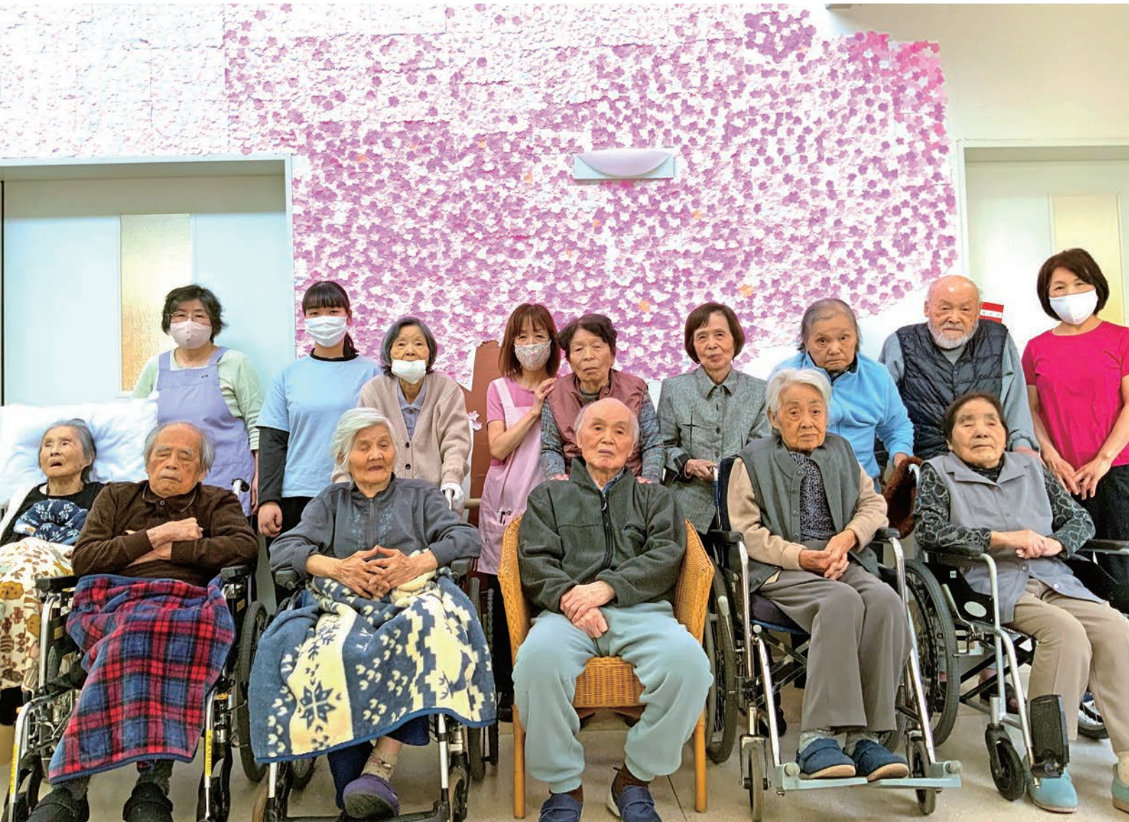
老人保健施設の利用者様。職員と利用者様で満開の桜を咲かせました。 ※感染対策を行いながら撮影しています。