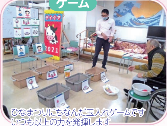
ひなまつりにちなんだ玉入れゲームです いつも以上の力を発揮します