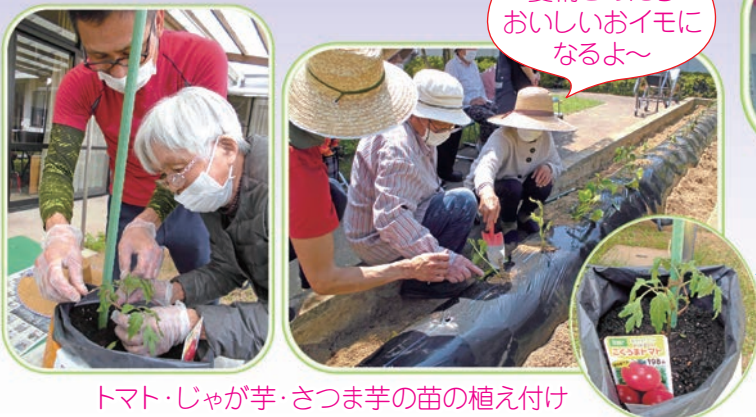
トマト・じゃが芋・さつまいもの苗の植え付け