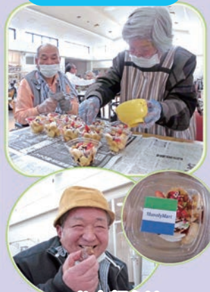
お店顔負け 「チョコバナナパフェ」