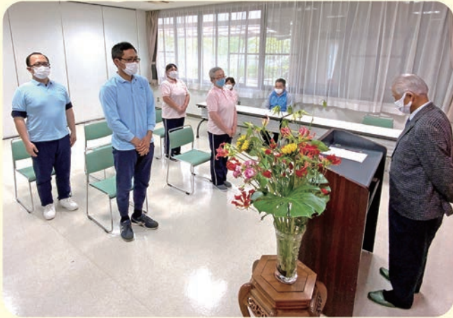
5年在職表彰式の様子