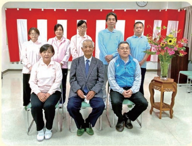
15年・10年在職表彰者