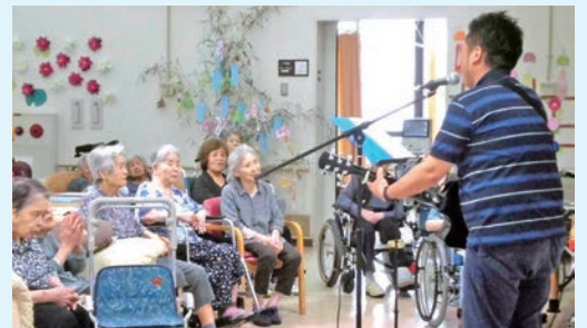
職員による演奏会