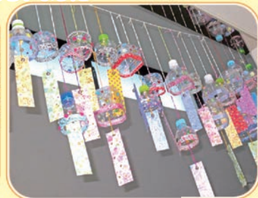
涼しげでカラフルな風鈴ができました