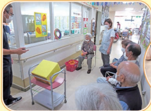
箱にボールを投げる