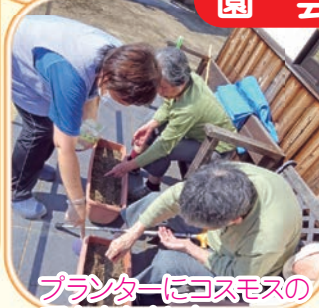
プランターにコスモスの 種をまきました

コロナ禍ですが、限 られた空間で少しでも 楽しく生活できるよ うに工夫しています。