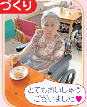
とてもおいしゅう ございました♡