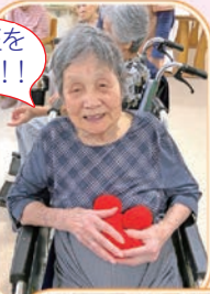
たくさん玉を 入れるで~!!