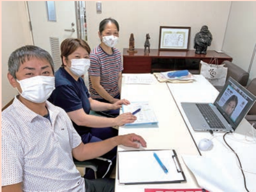
介護職員の喀痰吸引等研修の様子

新型コロナウイルスによって、県をまたいでの移動が難しくなり、学ぶ機会が減っていましたが、オンラインによる研修が受講できる環境が整いました。時間や場所を問わずに研修を受けることができ、学べる環境が確保できています。今後も積極的にオンライン研修を活用し、職員のスキルアップを目指していきます。