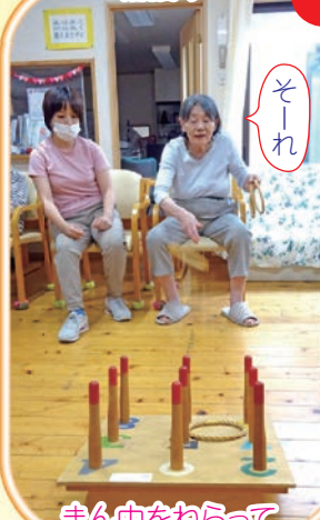
まん中をねらって... 入るかな~