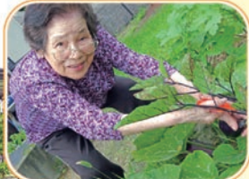
春に植えた苗を育て 収穫しました