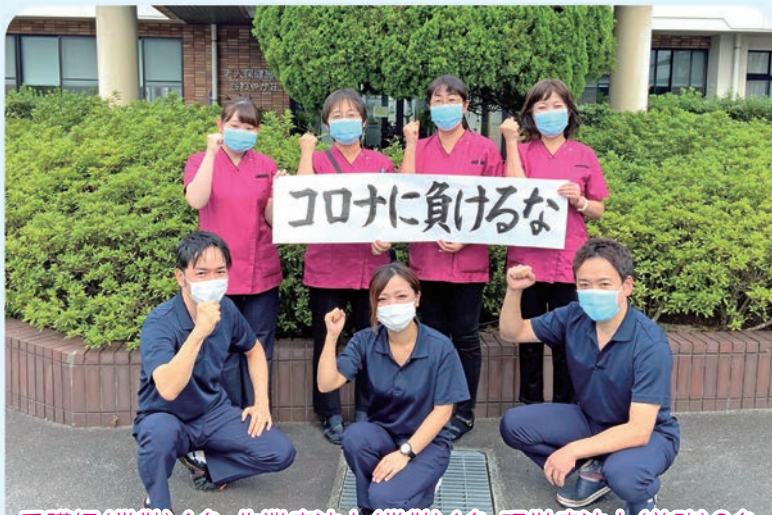
看護師(常勤)4名、作業療法士(常勤)1名、理学療法士(兼務)2名

さわやか荘訪問看護ステーションの開設から5年が経過しました。今年の4月より、看護師・理学療法士各1名が増員となり、ステーション内も新しい風に包まれています。