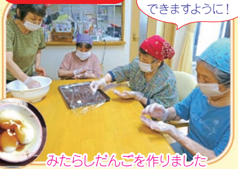
おいしいだんごが できますように!