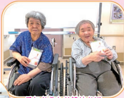
これからもお健やかに いつまでもお元気で