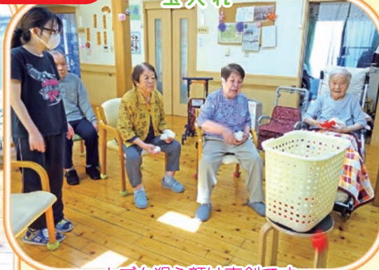
カゴを狙う顔は真剣です