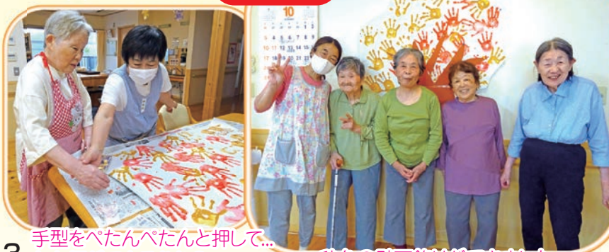
3 手型をべたんべたんとして... さあ何ができるかな?