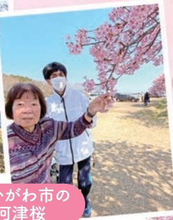
東かがわ市の河津桜