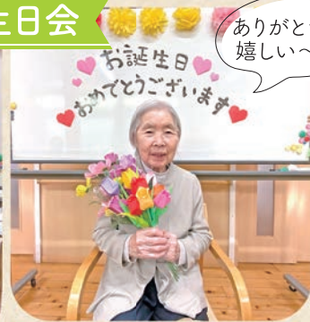
皆さんでお祝いしました