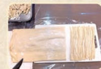
生地を踏んで伸ばす作業を手伝っていただきました