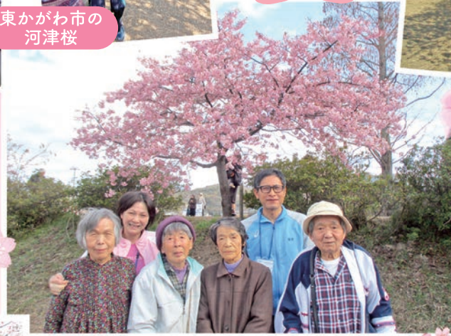
利用者様と春を楽しみました