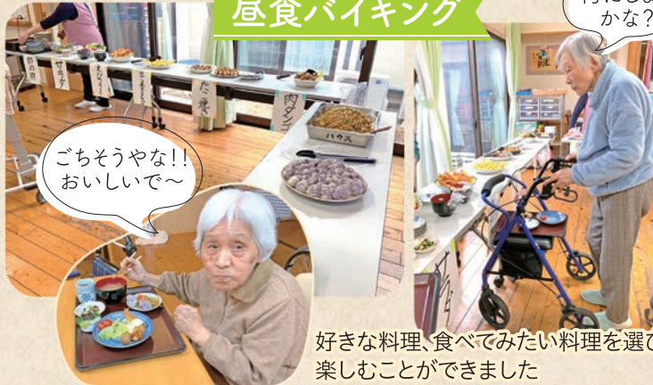
ごちそうやな!! おいしいで~