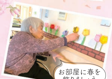
お部屋に春を飾りましょう