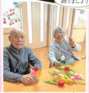
おりがみでチューリップ