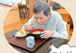
コシがあっておいしい